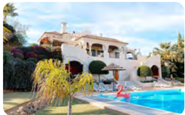
✔ Avec soleil