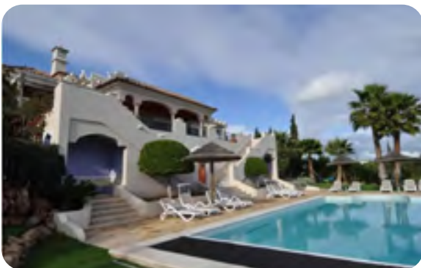
✘ Sans soleil

Ainsi, photographiez toujours avec la lumière et les rideaux ouverts.